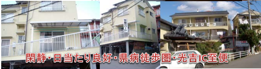
閑静・日当たり良好・県病徒歩圏・光吉IC至便