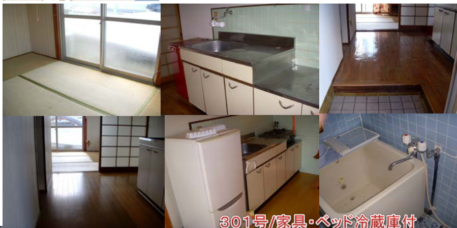
301号/家具・ベッド冷蔵庫付