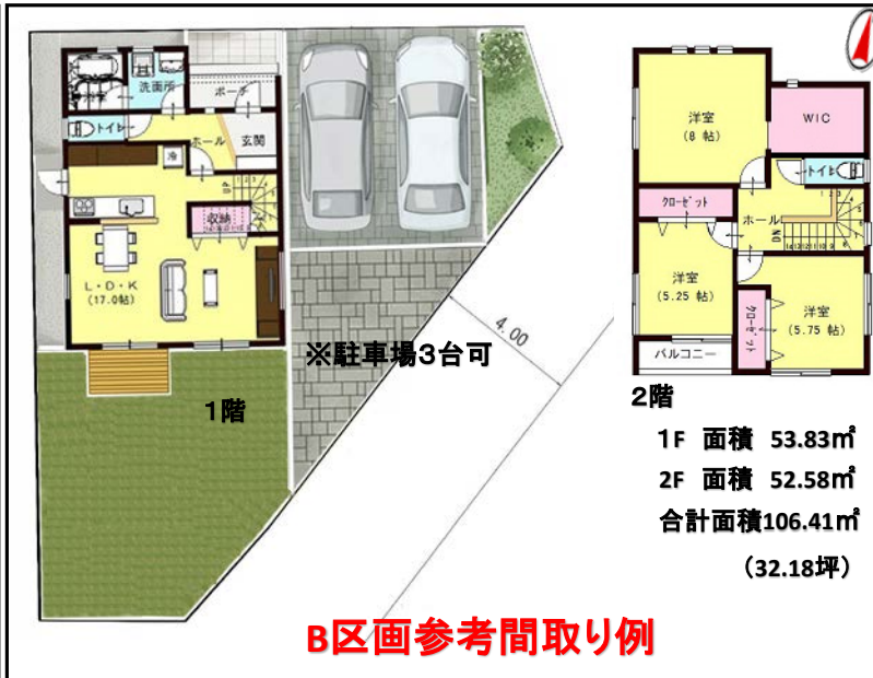
B区画参考間取り例