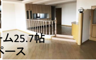
リビングルーム25.7帖 広々スペース